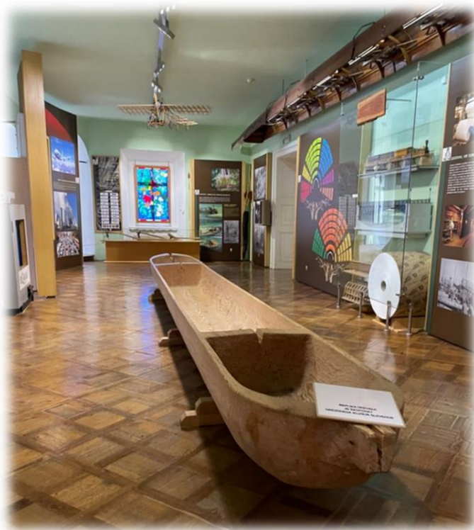
Anej Svrznjak, 2. B MIZ

Videli smo tudi zelo star hlod, ki so ga našli na barju. Ogled razstave je bil zanimiv zaradi različnih zanimivih eksponatov ter dobro pripovedovane zgodovine.